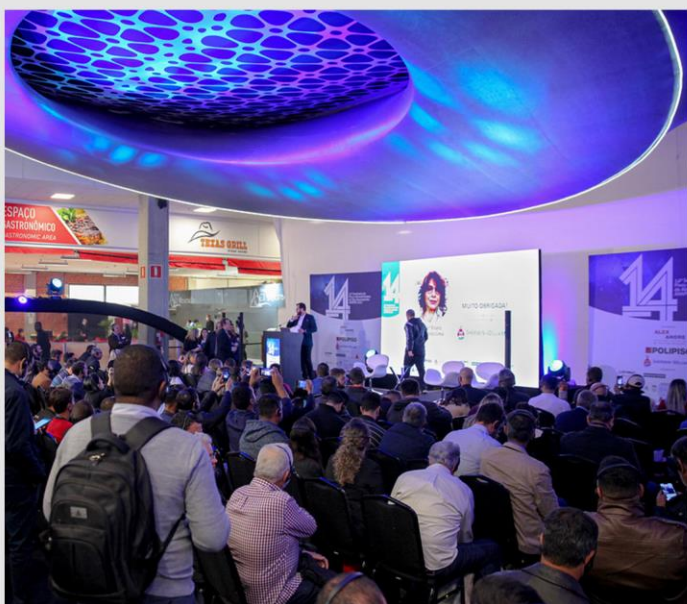
CONCRETE SHOW 2022

Além desses da presença nesses eventos, fizemos uma visita à Construtora e Incorporadora Tack, em Marília - SP. A origem da Tack também está ligada a uma família de um pai e suas três filhas. Foi essa história, similar à do Grupo NC, que nos aproximou e nos fez ir até o interior de São Paulo conhecer a incorporadora. A troca de experiências foi riquíssima e muitas outras similaridades entre as duas empresas vieram à tona: integridade, seriedade, foco no cliente e empreendimentos de alta qualidade. Foi uma ótima experiência de benchmarking, a partir da qual foi possível conhecer um exemplo do que há de melhor sendo feito no mercado.