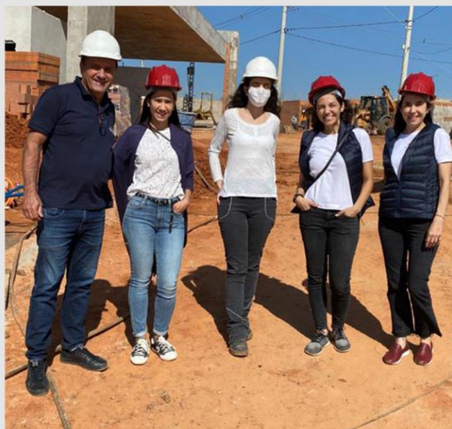
VISITA A TACK